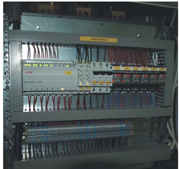
Stycznikowy moduł automatyki SZR

Zarówno moduły PA1100 jak i PA1001 można stosować dla prądów kategorii AC-1 od 30 do 400A. Jako elementy wykonawcze zastosowano styczniki serii CRNI i CRLI ze stykami pomocniczymi i blokadą mechaniczną.